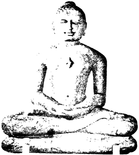
तीर्थंकर वर्तमान-महावीर जिनकी निर्वाण-व्रतशला राष्ट्र मना रहा है ।